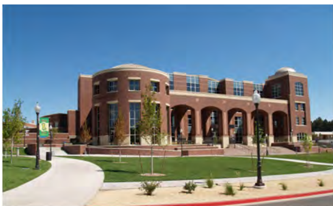
La biblioteca principal de UNR, sede de la Basque Library y del Centro de Estudios Vascos.

En 2016 se registraron 11.808 descargas, y en 2018 ya eran 14.399; 17.071 descargas en 2019, 69.849 descargas en 2020 y 60.933 descargas en 2021. Esto supone que entre 2016 y 2021 se han descargado desde los cinco continentes: 175.735 libros de la CBS Press o un promedio de 80 libros por día (desde 2016), 2.700 descargas por título anualmente de promedio. Este gran éxito de difusión supone una gran aportación a los estudios vascos.