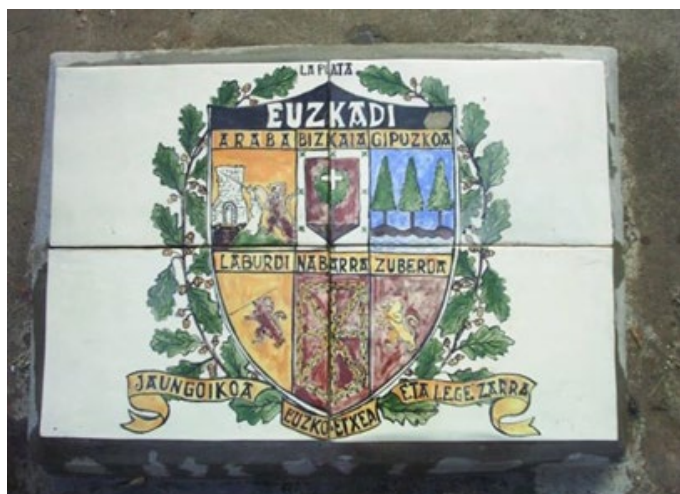
Fig. 5 Placa al pie del retoño en el Jardín de la Paz, en el Bosque de La Plata, durante el 70º aniversario del bombardeo de Gernika, el 28 de abril de 2007.

Gernikako Arbola da bedeinkatua, euskaldunen arte angutzimaitatua. Emantazabalzaz munduan frutua.