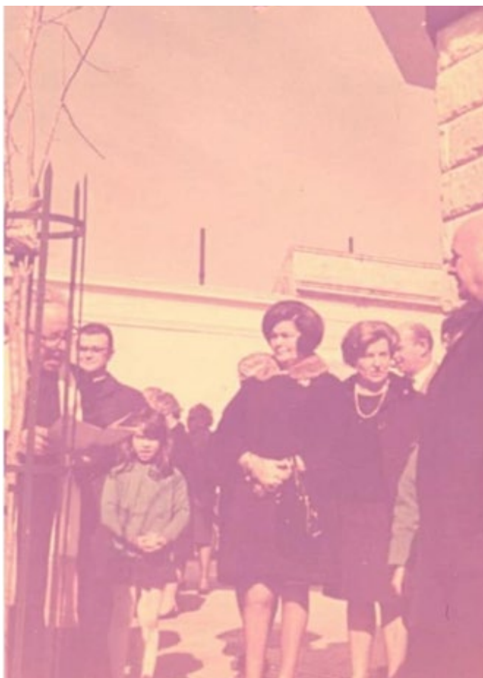
Fig. 3 Los retoños en la fachada del Centro Basko, 58 y 14. c. 1969