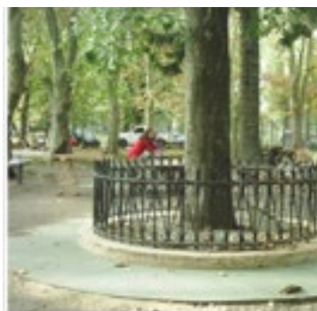
Fig. 1 Retoño del roble de Gernika del Parque Pereyra Iraola