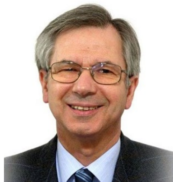
Juan Manuel Sinde

En el link siguiente http://arizmendiarietafundazioa.org/documentacion/videos/arizmendiarieta-el-milagro-de-mondragon-version-20m se puede ver un documental de 20 minutos de duración, que resume su vida y obra. Lo ofrece la Fundación Arizmendiarieta, institución que gestiona el proceso de canonización y se preocupa, asimismo, de difundir su legado, principalmente en el ámbito socio empresarial de Euskal Herria. A través de su propuesta de Economía de Cooperación y su aplicación en el Modelo inclusivo participativo de empresas la Fundación que lleva su nombre pretende actualizar el legado de Arizmendiarieta buscando humanizar la empresa y la actividad económica, haciéndola a la vez más competitiva y sostenible.