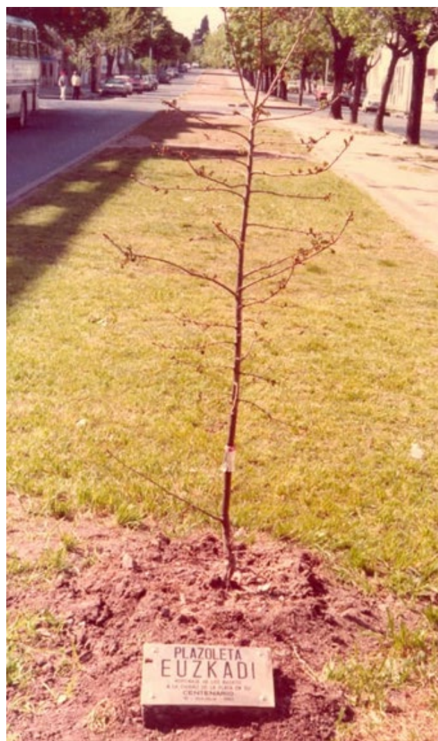
Fig. 4 Centenario de La Plata, 1982. Plazoleta Euzkadi, Av. 13 y 55.