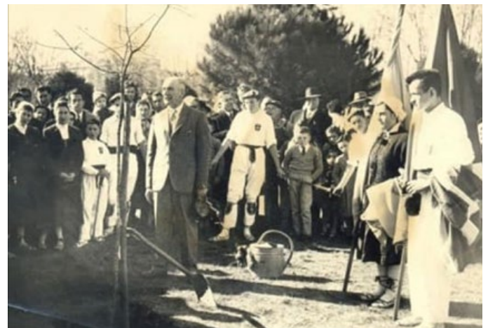
Fig. 2 Plantación del Roble en Plaza Moreno, julio de 1956