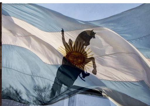
Está presente en infinidad de plazas Argentinas.