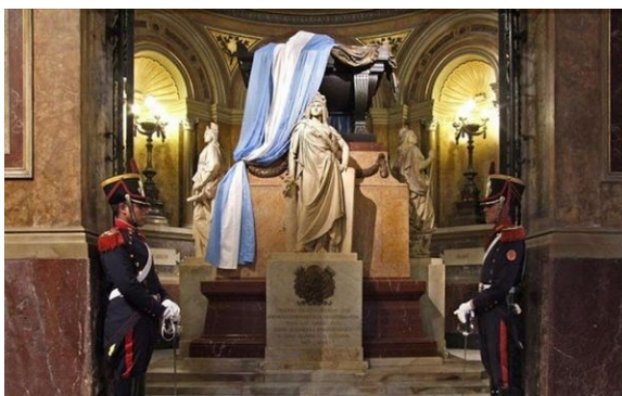
Mausoleo de José de San Martín, en la Catedral de Buenos Aires.